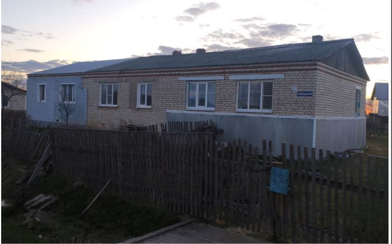
Фото объекта недвижимости ул.Центральная д.27