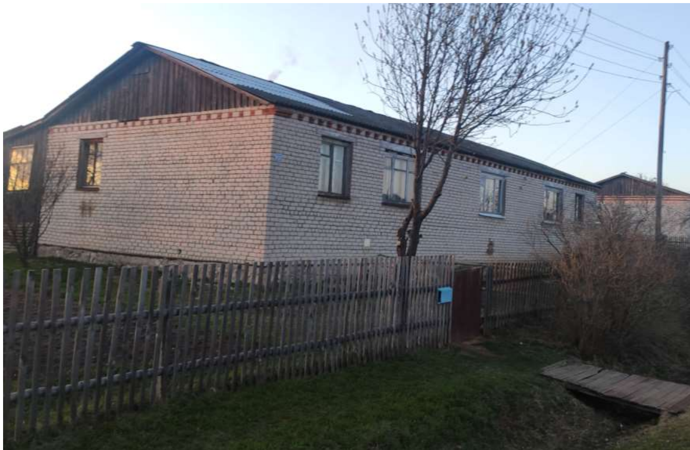
Фото объекта недвижимости ул.Центральная д.23