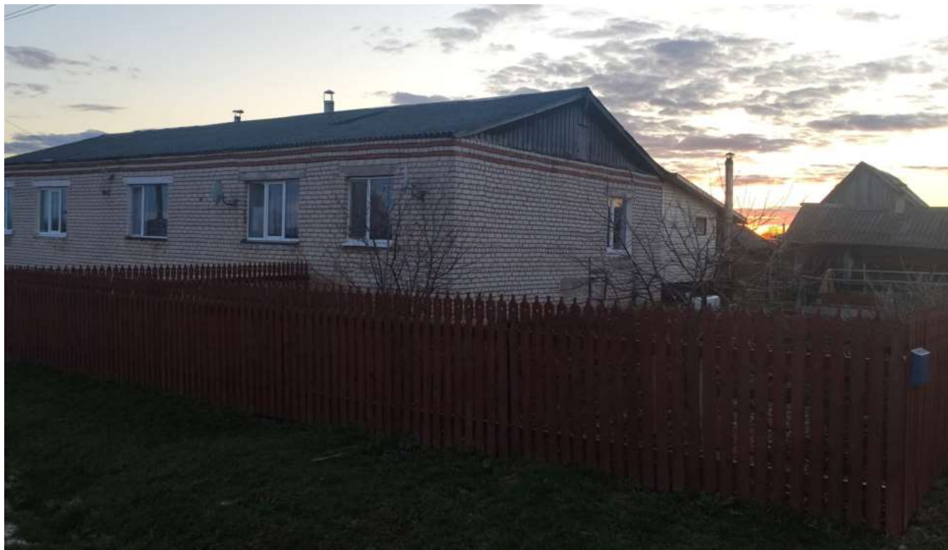
Фото объекта недвижимости ул.Центральная д.25