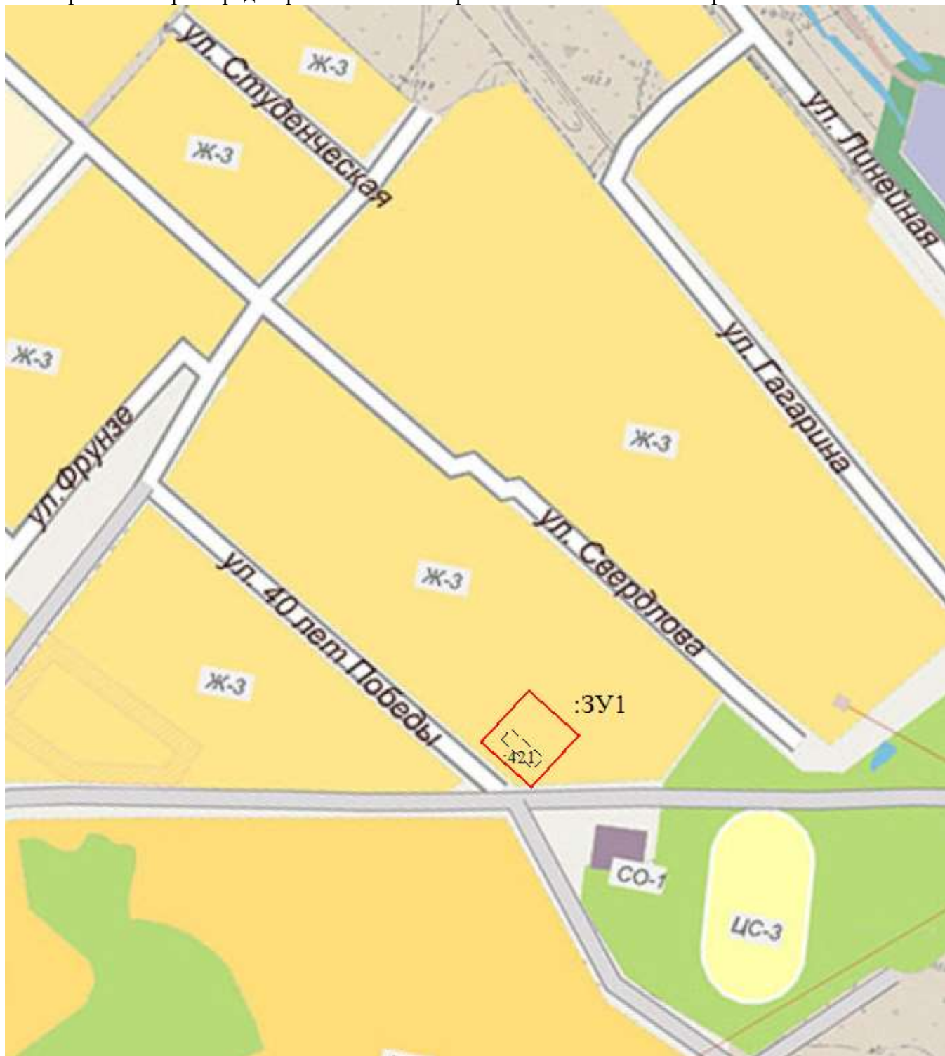
Рис. Фрагмент карты градостроительного зонирования с нанесенными охранными зонами

В соответствии с Правилами землепользования и застройки городского округа Шахунья Нижегородской области (утвержденные решением Совета депутатов городского округа город Шахунья Нижегородской области от 28.03.2019 г. № 26-11), формируемые участки расположены в зоне Ж-3.