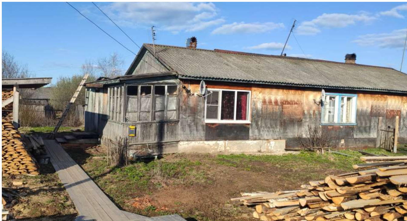
Фото объекта недвижимости ул.40 лет Победы д.16